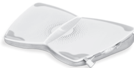
PRODUCT SCHEMATIC DRAWING